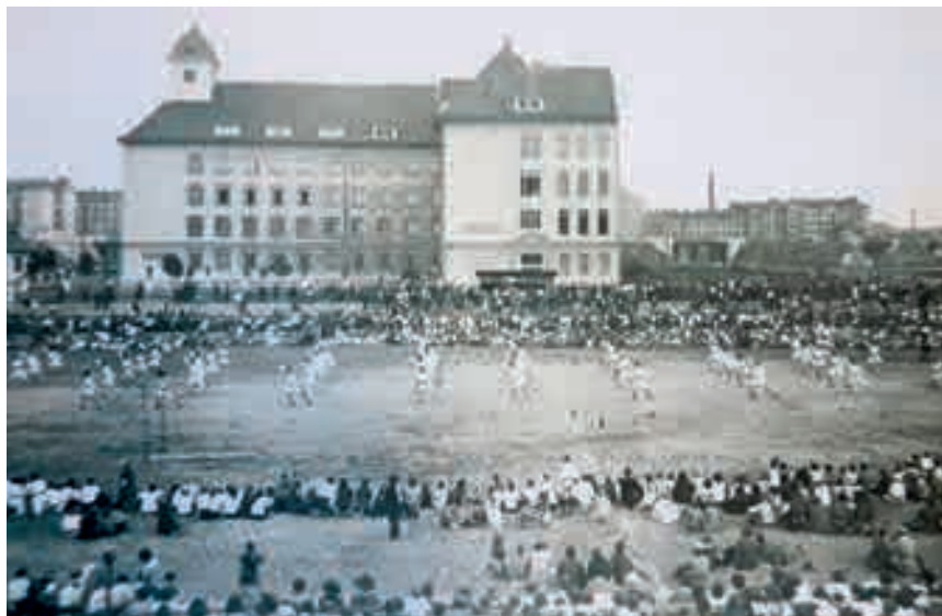
Vorführung am Ostmarkplatz im Jahr 1923 vor der Schule Stromstraße/Vorgartenstraße